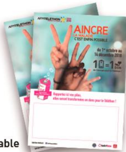
Affiches A3 personnalisable

Vous pouvez personnaliser votre communication grâce à l'affiche personnalisable (à gauche).