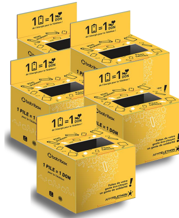
Cartons Téléthon (20 kg/collecteur)