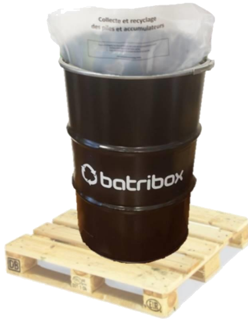
Fût Batribox (200L) avec sache plastique