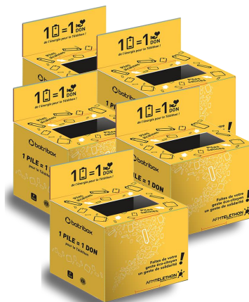
Cartons Téléthon (20 kg/collecteur)