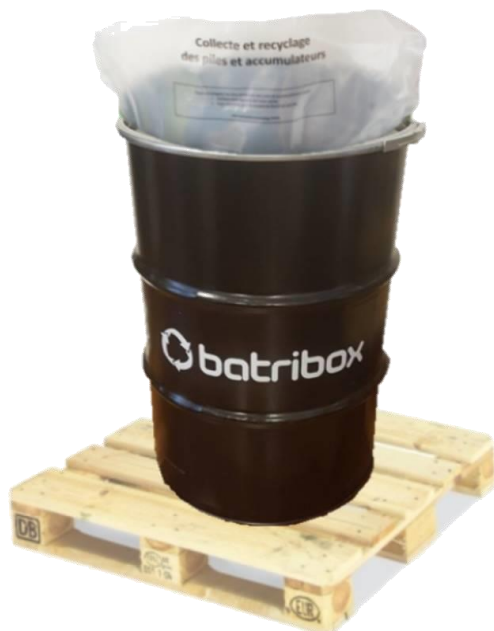
Fût Batribox (200L) avec sache plastique