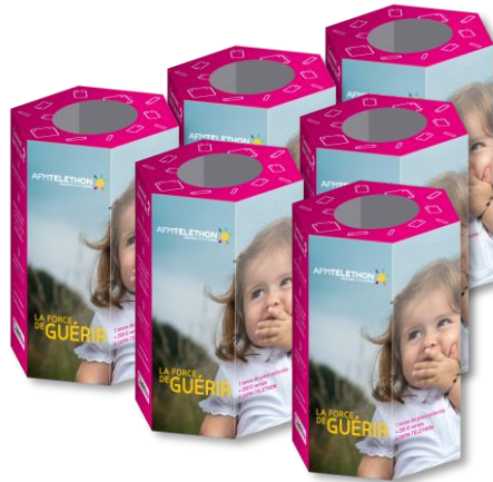
Mini-Batribox Téléthon (1kg / collecteur)